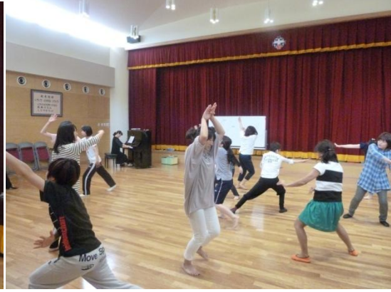
(ガチャガチャ、ドンドン、カーンカーン)